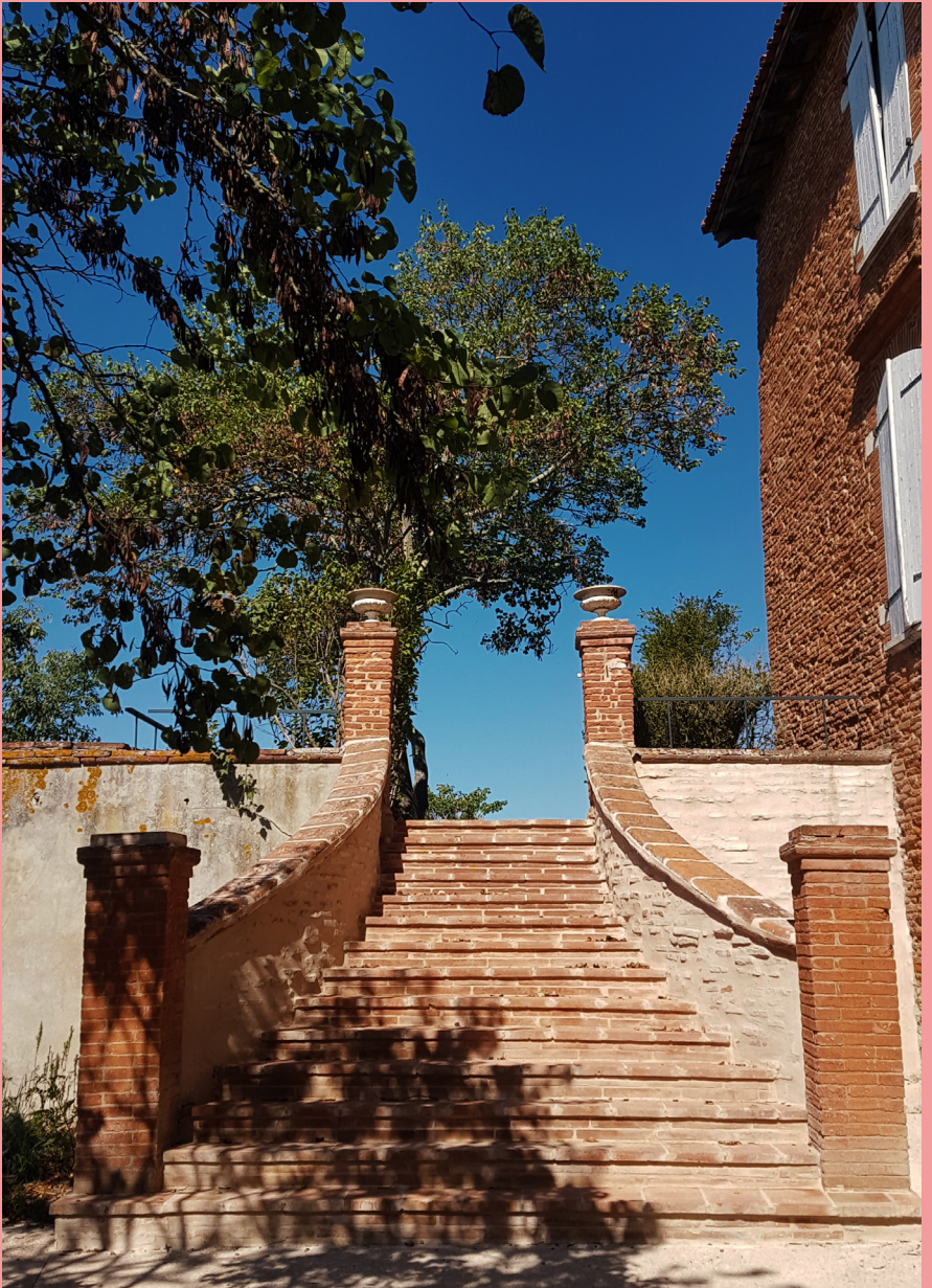
Le Château d'en-haut