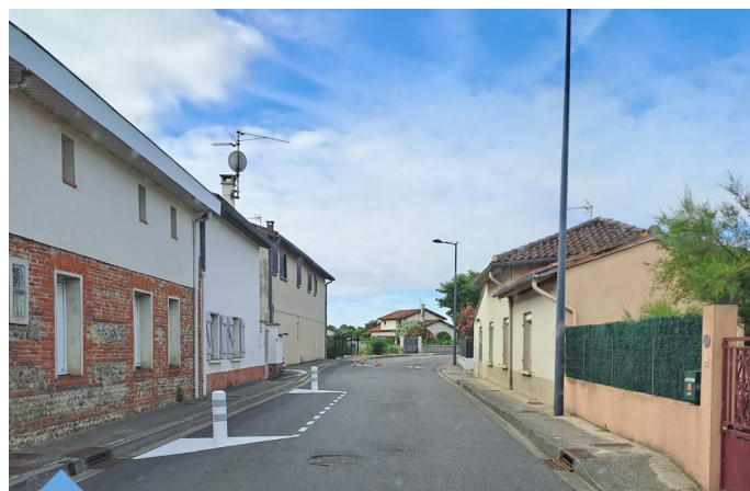
Aménagements de circulation Route de Colomiers.

> Centre-ville : des perturbations de circulation sont à prévoir rue du Pont vieux et avenue de Versailles en août. La démolition des bâtiments existants au bas de l'avenue de Versailles a débuté. Des aménagements provisoires seront réalisés d'ici cet automne en attendant les aménagements définitifs prévus à l'été 2025.