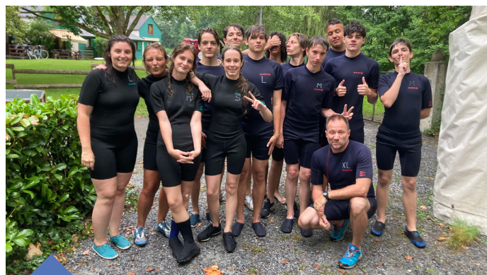
Séjour culturel à Laruns dans les Pyrénées-Atlantiques du 12 au 19 juillet.

Le deuxième temps - moment fort du festival - s'est déroulé le 1 er juin à partir 18h, toujours à l'Aria, avec le spectacle Les Yeux ouverts . Interdisciplinaire et entièrement co-créé tout au long de l'année par 20 jeunes du PAJ de Cornebarrieu, accompagnés par 4 artistes intervenants, ce spectacle a conjugué danse, théâtre, chant et cinéma. La soirée qui a suivi a permis de prolonger ce moment de culture et de partage entre jeunes et moins jeunes.