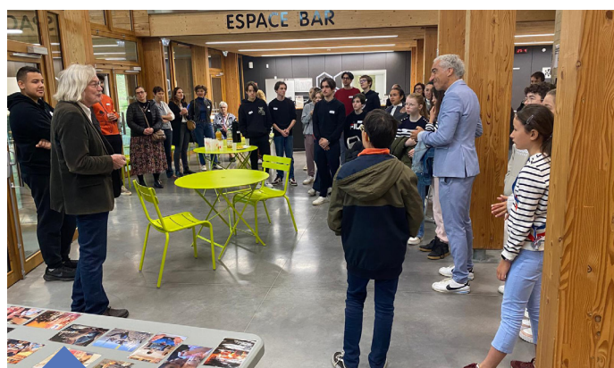
Rencontre intergénérationnelle du 27 avril à l'Aria.

Premier temps : le samedi 27 avril de 9h à 13h, l'Aria a accueilli une rencontre intergénérationnelle qui a regroupé une trentaine de jeunes élus issus de plusieurs Conseils Municipaux de la Jeunesse du territoire (Blagnac, Pibrac et Cornebarrieu) et autant d'adultes, représentants de différentes instances du territoire (élus municipaux, associations, habitants,..). Toutes ces personnes ont pu mener une réflexion commune sur la jeunesse et plus particulièrement sur son engagement et sa vision de la citoyenneté. Cet échange s'est construit autour de plusieurs ateliers ludiques et coopératifs – un atelier radio, un jeu de prise de décisions collectives et un photo-langage. Une exposition sur la création du spectacle Les yeux ouverts a également été présentée.