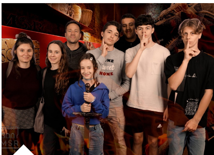
Samedi 18 mai, les jeunes du PAJ étaient au Musée Saint-Raymond à Toulouse pour « La nuit au musée » sur la thématique médiévale.