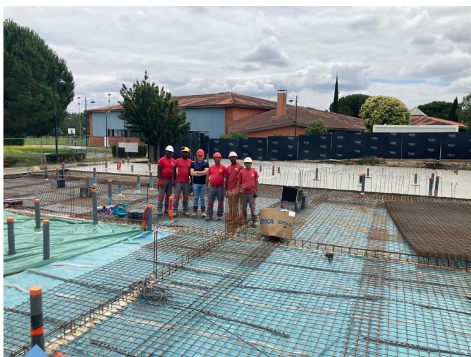
La dalle du futur restaurant scolaire des Ambrits.

> Groupe scolaire des Ambrits : la dalle du futur restaurant scolaire est achevée et les premières élévations ont débuté en juillet. Sur le bâtiment existant, le travail sur les fondations a débuté. Les premiers travaux de Voirie et Réseaux Divers seront réalisés cet été, notamment la mise en place des réseaux humides.