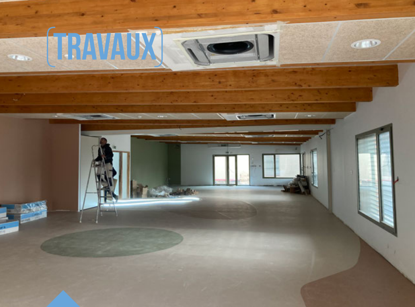
La salle commune de l'ALAE des Monges.