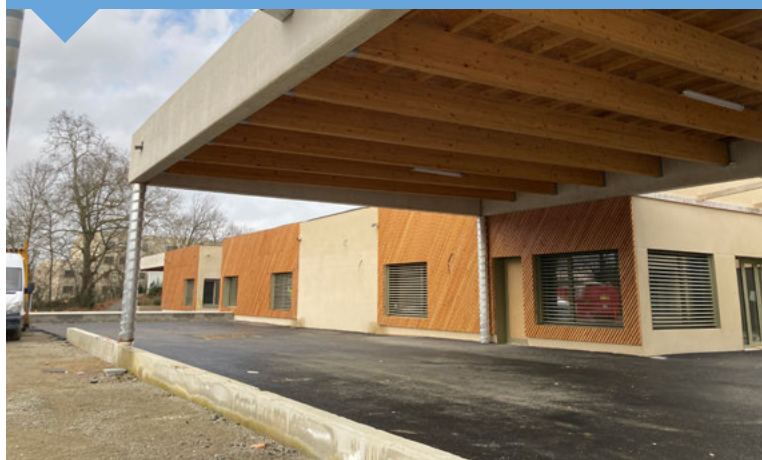
Vue extérieure de l'ALAE des Monges.

Après 18 mois de travaux, l'accueil de loisir des Monges est en passe d'être livré. Le 24 janvier, les équipes éducatives de l'ALAE ont visité le chantier quasiment achevé (réception prévue en mars). Unanimement emballées par leur futur nouvel outil de travail, elles ont désormais hâte d'y accueillir les enfants. La ré-ouverture de l'ALAE est prévue après les vacances de printemps , tandis que cet été, les habitués du centre de loisirs profiteront pleinement de ces nouvelles installations.